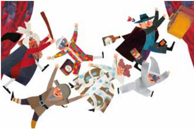
Giulia Oreccia A teatro con Gianni Rodari Einaudi Ragazzi, 2018 Digital collage 33,2 x 22cm

Los alumnos de 6° grado deberán elegir una de las tres ilustraciones que se presentan a continuación y realizar una narración (inspirada en la ilustración). Luego las producciones se compartirán con el resto de la comunidad educativa.