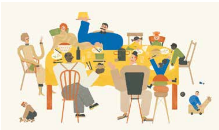
Gaia Stella Bambini e bambole Emme Edizioni, 2019 Digital 51 x 30,5cm